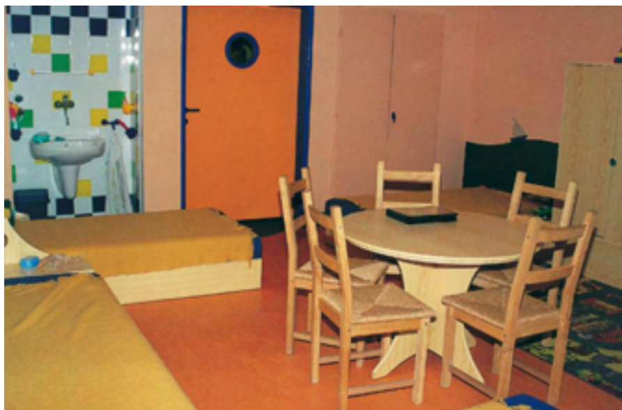
Pokoj dětského oddělení