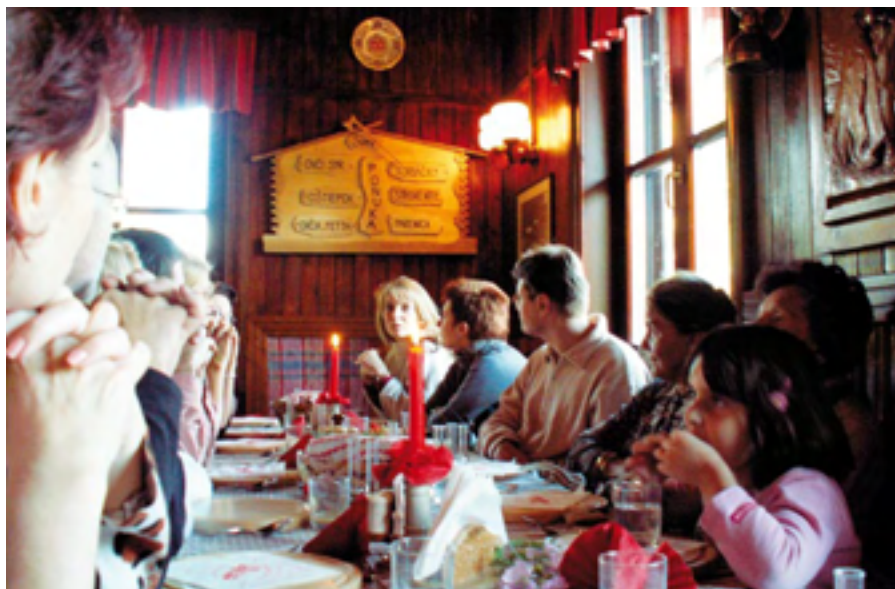
III. Levočské pracovné dni neuropsychiatrie a algeziológie vo vertebrológii, Levoča, 13.-14. 10. 2005. Nejen pracj živ je člověk...