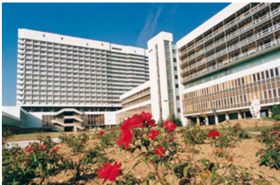
Fakultní nemocnice Brno