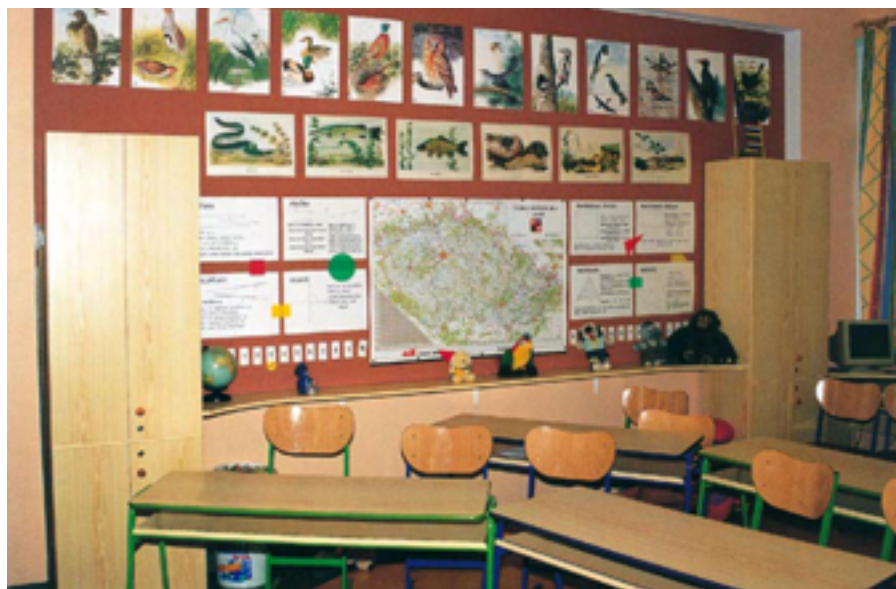
Školní třída na dětském oddělení