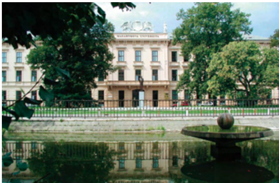
Lékařská fakulta Masarykovy univerzity Brno