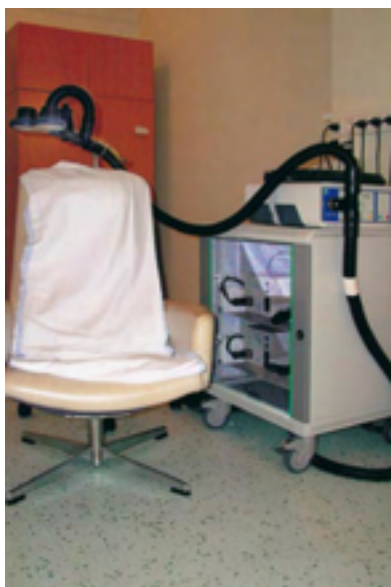
Přístroj pro reprezentativní transkraniální magnetickou stimulaci – nová možnost léčby deprese